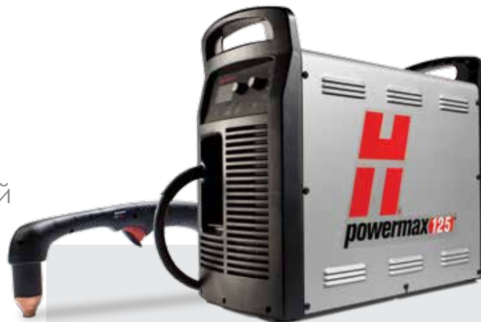
Стандартные типы резаков Duramax (дополнительные варианты резаков см. на веб-сайте www.hypertherm.com )

Профессиональная система плазменной резки и строжки металла для ручной резки материалов толщиной до 38 мм и механизированного прожига материалов толщиной до 25 мм.