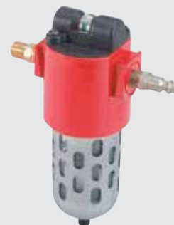
Комплект для фильтрации воздуха