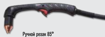
Ручной резак 85°