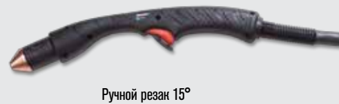
Ручной резак 15°