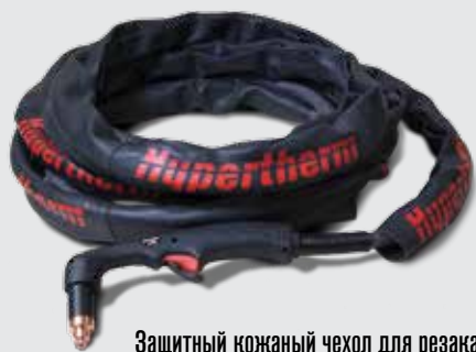
Защитный кожаный чехол для резака