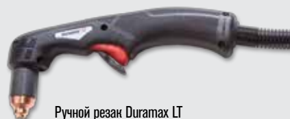
Ручной резак Duramax LT