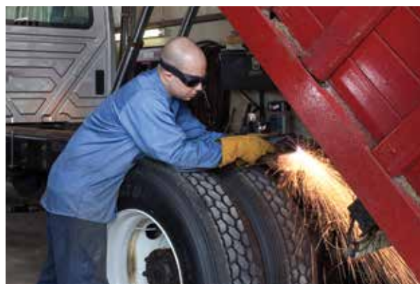
Ремонт и переоборудование машин